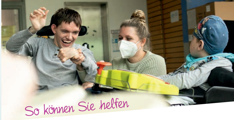
So können Sie helfen

Film: „Wir sind Helfende Hände e.V. und gGmbH!“ https://www.youtube.com/watch?v=GoJs18CzgDk